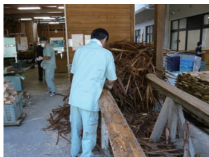
① 背板（端材）の樹皮をむく