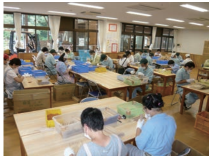
⑩ 選別（不良品を取り除く）