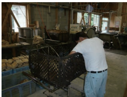
⑤ 背板をカゴに詰める