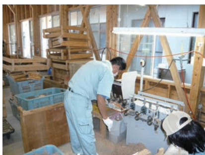
⑪ 面取り（四隅と中溝の面を取る）