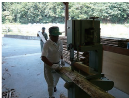
② 製材1 背板を15cm幅に切る