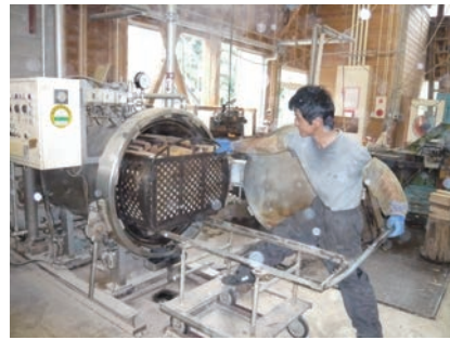
⑥ 高圧釜に入れて蒸す