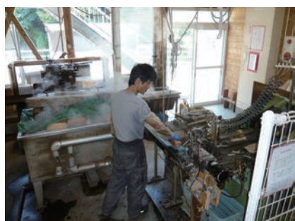
⑦ 箸の厚さにスライス裁断