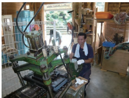
⑧ 箸の形にプレス裁断