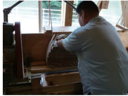
⑫ 磨いて表面をなめらかにする