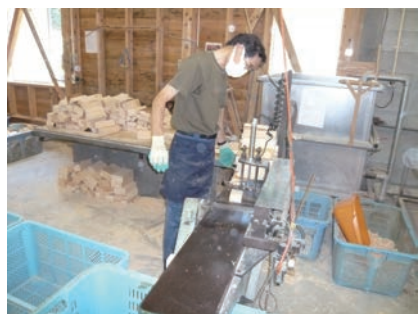
④ 板面をカンナがけする