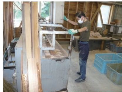
③ 製材2 箸の長さに切りそろえる